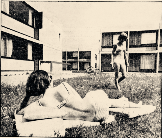
Mellem de fire og otte etagers boligblokke med lejligheder fra 30 til 130 kvadratmeter til priser fra 375 kr. til 1200 kr. ligger to-etagers kollegier for unge under uddannelse.