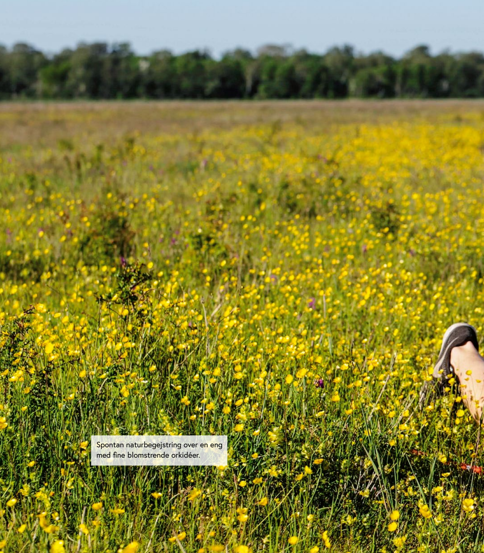
Spontan naturbegejstring over en eng med fine blomstrende orkidéer.