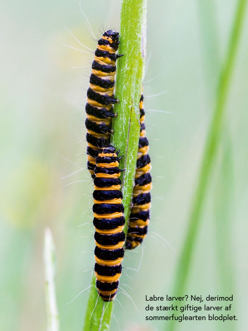
Labre larver? Nej, derimod de stærkt giftige larver af sommerfuglearten blodplet.