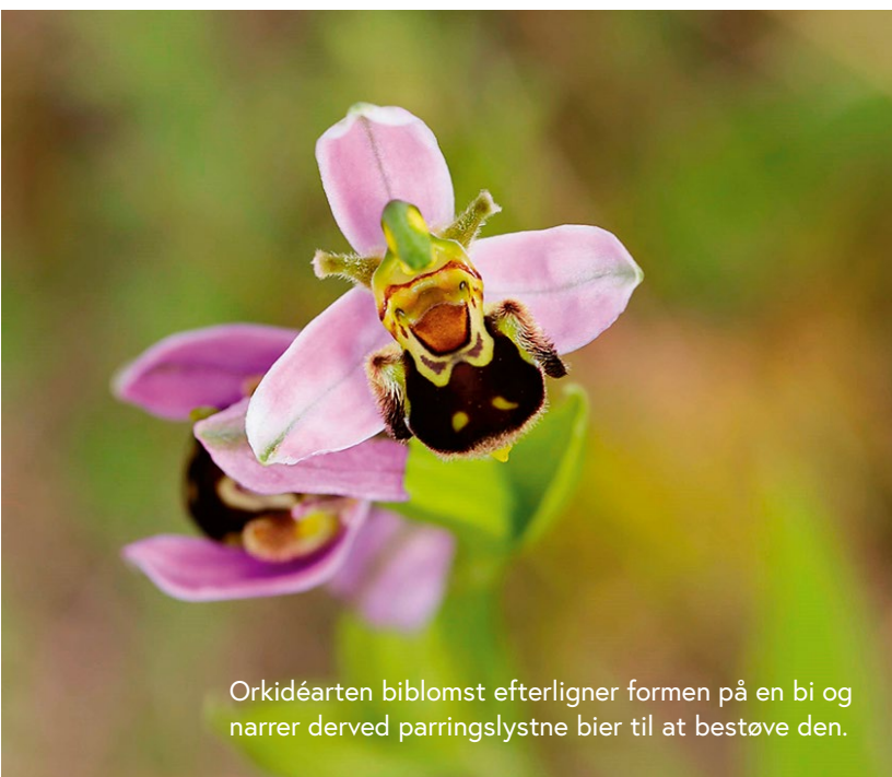
Orkidéarten biblomst efterligner formen på en bi og narre derved parringslystne bier til at bestøve den.