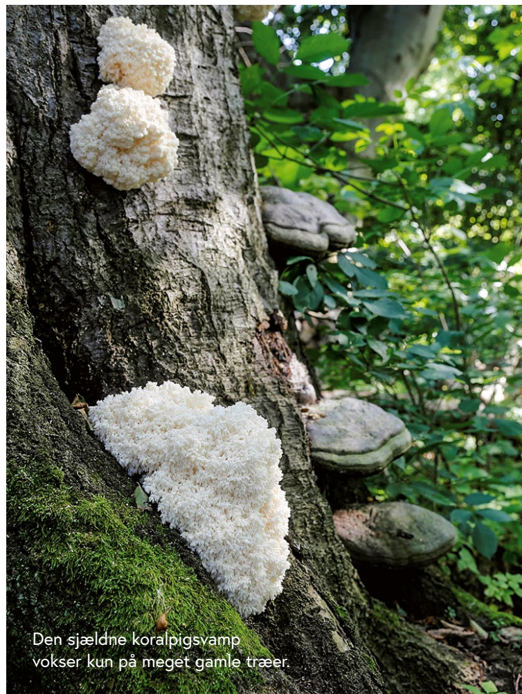
Den sjældne koralpigsvamp vokser kun på meget gamle træer.