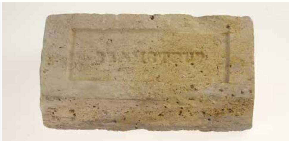
ILL. 3. Mursten med præg fra Bramstrup teglværk, hvor Carl Nielsen arbejdede som dreng.

Arbejderne var indkvarteret i et af Bramstrups huse, så det var ikke kun ved ankomsten, de passerede familien Niensens hus. For Carl Nielsen var det en særlig oplevelse, når de kom, men de var også en del af hverdagen: