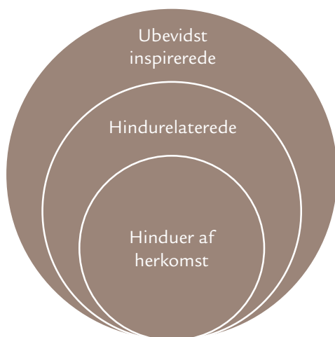
Figur 2. De tre typer af hinduisme.

kategorier dannet særligt ud fra et 3.-, men også et 4.-ordensperspektiv, hvor de, jeg kategoriserer inden for gruppen, måske ikke selv ville gøre det samme. Det er, hvad man kan kalde spændingen imellem en forhåbentlig velbegrundet forskningsmæssig nødvendighed for at danne gode analytiske kategorier til at skildre den virkelighed, som altid på en eller anden måde vil gøre modstand, og så virkeligheden og genstandsfeltet selv – i dette tilfælde hinduisme og hinduer.