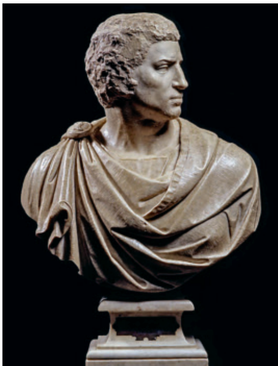
Fig. 3 | Portræt af Brutus udført af Michelangelo Buonarroti 1538.

ved Thapsos (i det nuværende Tunesien) i 46 f.v.t. og sidenhen ved Munda (i det nuværende Spanien) i 45 f.v.t.; ved sidstnævnte slag slog Cæsar Pompeius' sønner. Efter slaget ved Pharsalos var Cæsar for anden gang blevet udnævnt til diktator, denne gang for et år – han havde tidligere, i 49 f.v.t., været diktator i 11 dage. I april 46 f.v.t. blev han først udnævnt til diktator for 10 år og herefter på livstid – dictator perpetuo . Selvom romerne normalt valgte deres ledere, konsulerne, så havde senatet altid kunnet udpege en diktator for en afgrænset periode, dvs. lade én mand stå i spidsen for staten i krisetider. Men med udnævnelsen til diktator for livstid var Cæsar blevet enehersker i Romerriget, hvilket naturligvis ikke blev vel modtaget fra alle sider. Plutarch fortæller ganske vist, hvordan Cæsar afviste at bære en krone ( Cæsar 61, på græsk diadema – dvs. et diadem, der var et monarkisk emblem lig en krone), men alligevel voksede frygten for en genindførelse af monarkiet, som romerne nærrede en