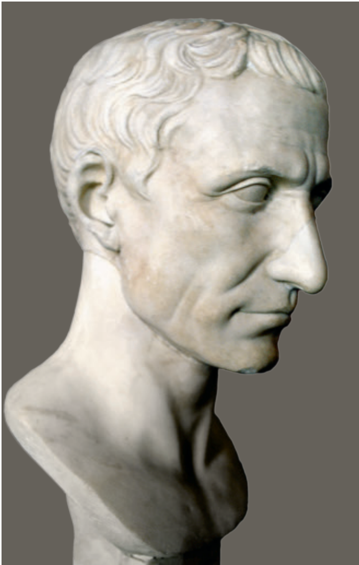
Fig. 1 | Portræt af Cæsar (Chiaramontitypen). Her ses portrættet i profil – et frontalt billede af portrættet ses i kapitel 6 (Fig. 5).

> Fig. 2 | Kort over Romerriget på Cæsars tid.