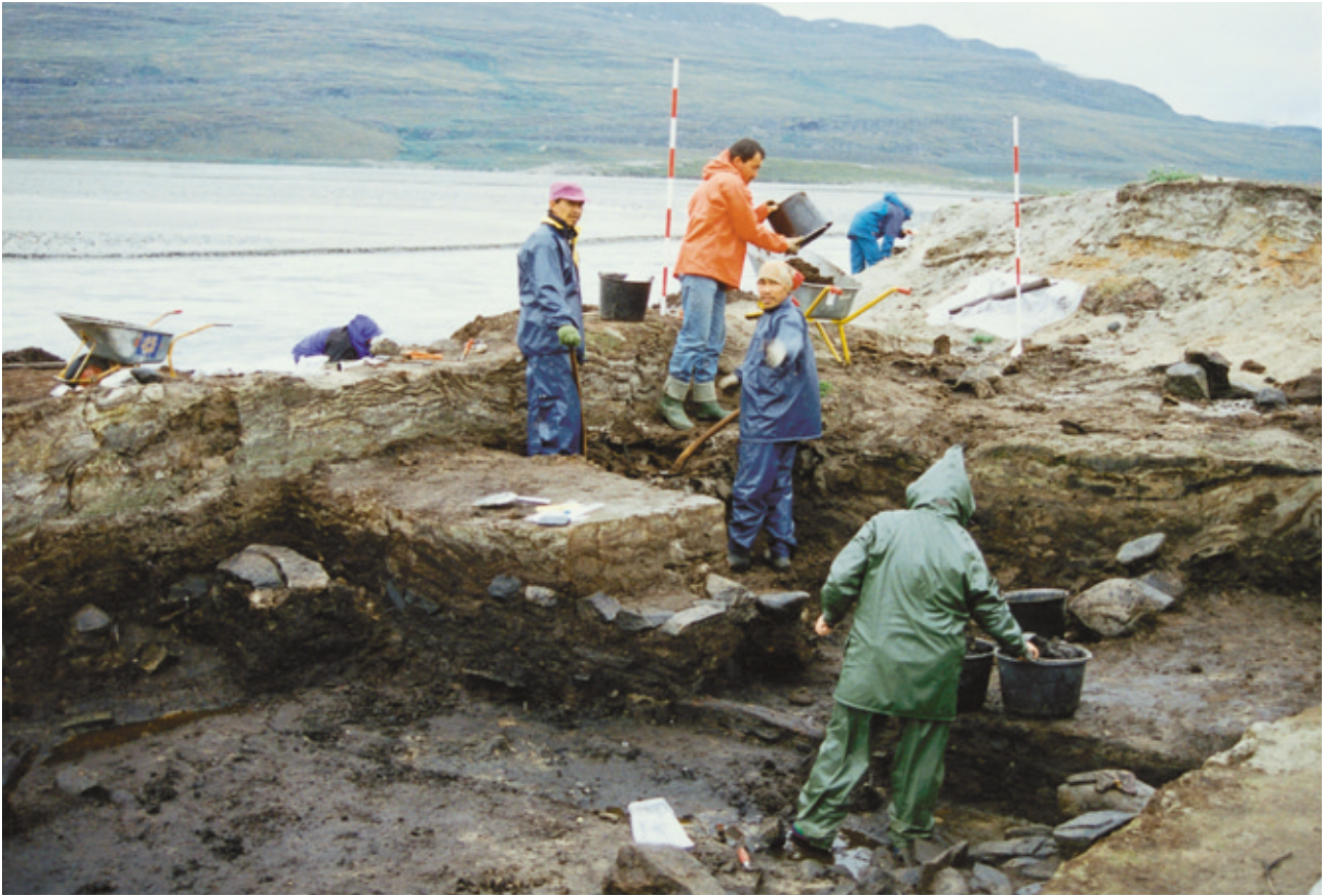
Fig. 3. Gården under Sandet i Vesterbygden blev udgravet igennem seks somre fra 1992 til 1997 med en gravesæson på fire uger hvert år. Til sidst måtte arkæologerne opgive. Elven overskyllede ruinerne.

med det iskolde smeltevand fra den nærliggende gletsjer fossende forbi, var opgaven tung og ikke ufarlig.