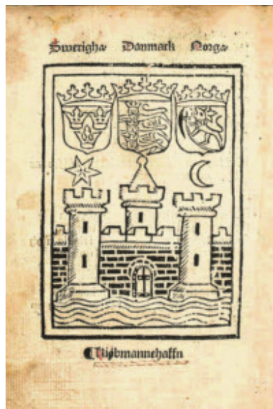
Fig.1.1.5. Side fra Rimkrøniken eller "Den danske krønike", der blev trykt i København 1495 af Gotfred af Ghemen. Man ser Sveriges, Danmarks og Norges rigsvåbner over en bymur, der symboliserer København. Billedet af byen ved havet er på ingen måde realistisk, men er en modificeret version af byens gamle segl.