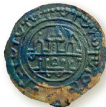
Fig. 1.1.3. Smykkebrakteat fra første del af 1100-årene med en idealfremstilling af en by med tårne og spir. Det omgivende bånd kan opfattes som en stiliseret bymur med 12 åbninger, og måske er motivet en symbolsk fremstilling af Guds by, Jerusalem. Smykket blev fundet ved gravning foran Det Gamle Rådhus i Ribe.

ter, som hertug Frederiks belejringshær lod slå i lejren foran København i 1523. 12