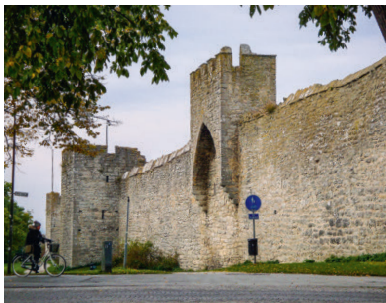
Fig. 1.2.3. Bymuren omkring Visby på Gotland i Sverige. Byen, der er omgivet af en over tre kilometer lang mur fra middelalderen, havde sin blomstring i tiden fra 1100-tallet og frem i 1300-tallet. Byen indgik i det danske rige fra kong Valdemar Atterdags erobring af den i 1361 indtil Sveriges overtagelse af den i 1645, og med en vis ret kan den altså regnes blandt de danske byer i denne tid.

holstenske greve Sønderjylland. Situationen vendte så i 1460, da Slesvigs bisp fra rådhuset i Ribe kunne forkyn- de, at det slesvig-holstenske råd havde valgt kong Chri- stian 1. af Danmark (1448-81) til "hertug af Slesvig og greve af Holsten". Dermed var den statsretlige linje lagt for området frem til nederlaget i 1864. 33