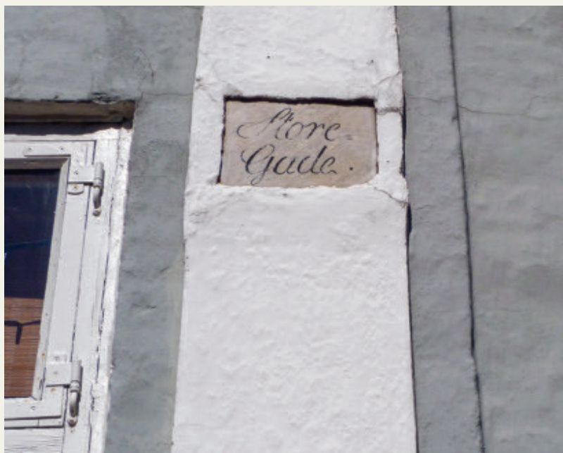
Fig. 1. Gadeskilt fra 1800-tallet fra Storegade i Randers. I middelalderen ledte denne gade ned mod å og havn. I byen blev gadenavnene første gang officielt fastlagt i 1798 og blev malet på gadehjørnerne.

Hovedgaden blev normalt betegnet ”Algade”/”Adelgade”, mens andre store gader kaldtes ”Hærstræde”, dvs. hærvej, ”Storegade” eller ”Bredgade”. ”Bredgade” er nævnt i Ribe allerede 1291. Naturligvis blev verdenshjørnerne ofte fra den ældste tid brugt i forbindelse med hovedstrøg, og i mange byer finder man ”Vestergade”, ”Østergade”, ”Nørregade” eller ”Søndergade”. Mejlgade i Aarhus hed i middelalderen ”Medelgade”, altså midtergaden. 99 Brolagte gader kunne få betegnelsen ”Stengade”, hvoraf en er nævnt i Roskilde ca. 1380. 100 Udfaldsvejene kunne også betegnes efter en nabo, som de var orienteret imod, f.eks. i Flensborgs