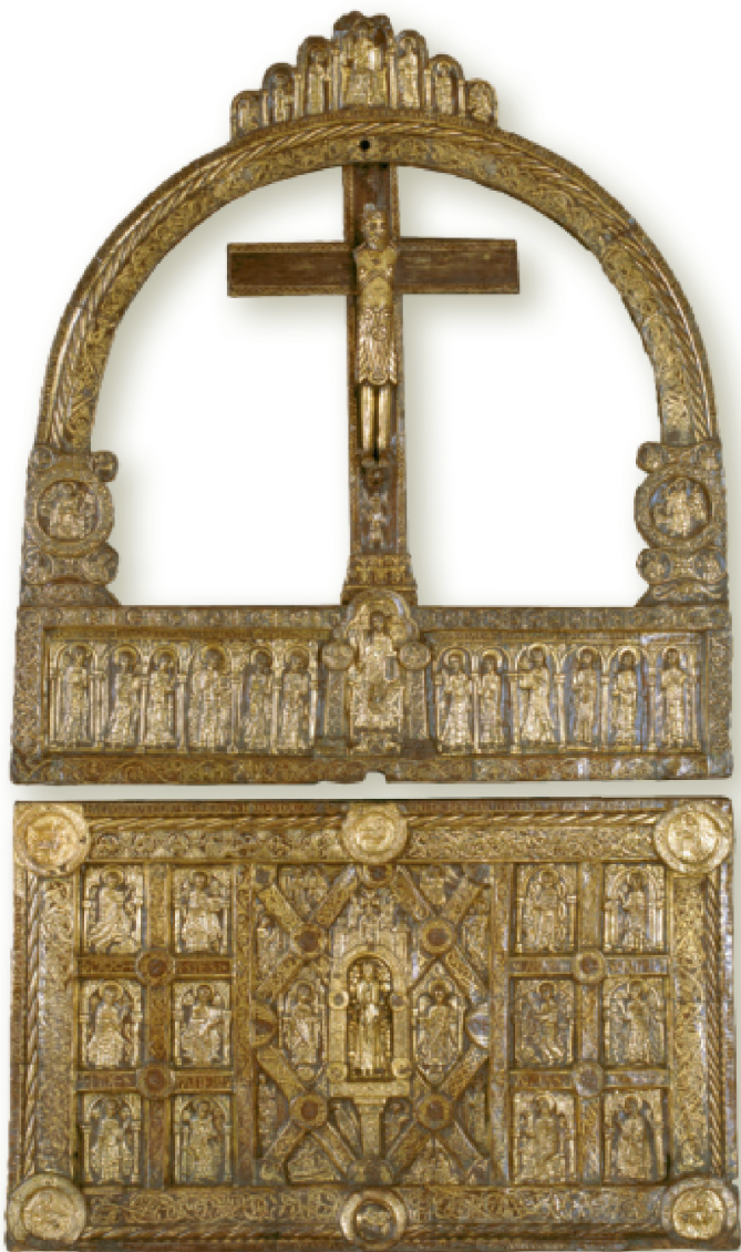
Fig 1.1.4. Byerne var udgangspunkt for kristningen af Danmark, og den by, der stod som idealet for den tidlige middelalders danske byer, var det himmelske Jerusalem. Den var beskrevet i Johannes' Åbenbaring: "Dens stråleglans er som den dyreste ædelsten, som krystalklar jaspis. Den har en stor og høj mur med tolv porte, og over portene tolv engle og indskrevne navne, det er Israels tolv stammers". Man opfattede i middelalderen Jerusalem ikke kun som en historisk by, men også som et billede på den kæmpende kirke – med en særlig betydning på grund af korstogene. I mange af landets kirker blev byen Jerusalem afbildet. Det gyldne alter fra Lisbjerg Kirke ved Aarhus, dateret til o. 1140, associerer også i sin helhed til denne. Over Lisbjergalterets midtfelt finder man sigende inskriptionen CIVITAS HIERVSAL(EM) (byen Jerusalem).