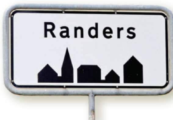
Fig. 1.1.2. Byer er ikke mere markeret på nogen særlig måde i landskabet, hvad der afspejler, at betegnelsen "by" ikke mere er præcis. Populært kaldes skilte som dette ganske vist for byskilte, men egentlig markerer de blot et tættere bebygget område, hvor færdselslovens regler for tættere bebygget område gælder.

Fig. 1.1.1. Carta Marina eller "Søkortet" er tegnet af Olaus Magnus 1527-39 og trykt som træsnit 1539 i Venedig. På kortet er de fleste danske byer indtegnet.