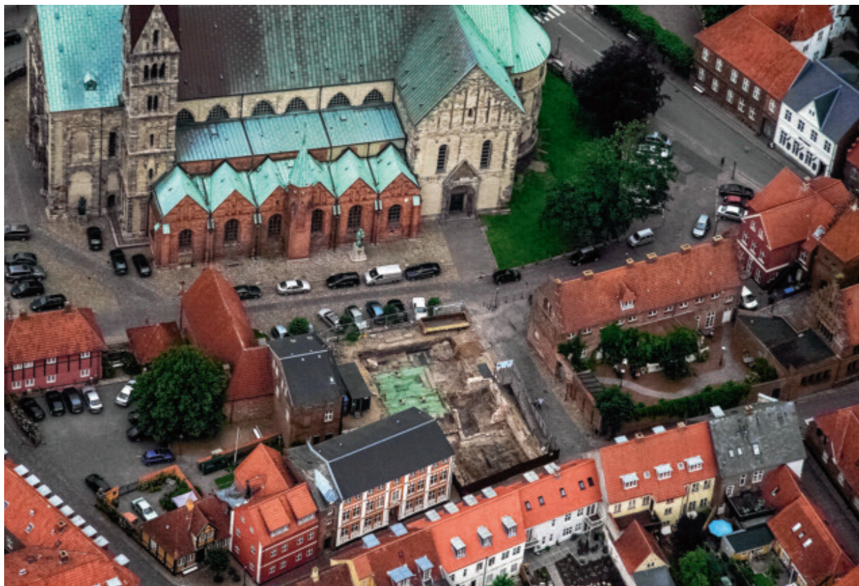
Fig. 1.3.2. Udgravning i 2008-09 i Ribe syd for domkirken. Udgravningen ændrede helt opfattelsen af Ansgars Ribe. Undersøgelserne viste, at der ved domkirken havde været en meget tidlig kirkegård, som gik tilbage til slutningen af 800-tallet. Før denne udgravning havde nogle forskere egentlig betvivlet, om Ansgar virkelig fik bygget en kirke i Ribe.

og 1980'erne, tolket som en lang række selvstændige anløbsbroer. Sådan blev de også gengivet gang på gang i litteraturen. 43