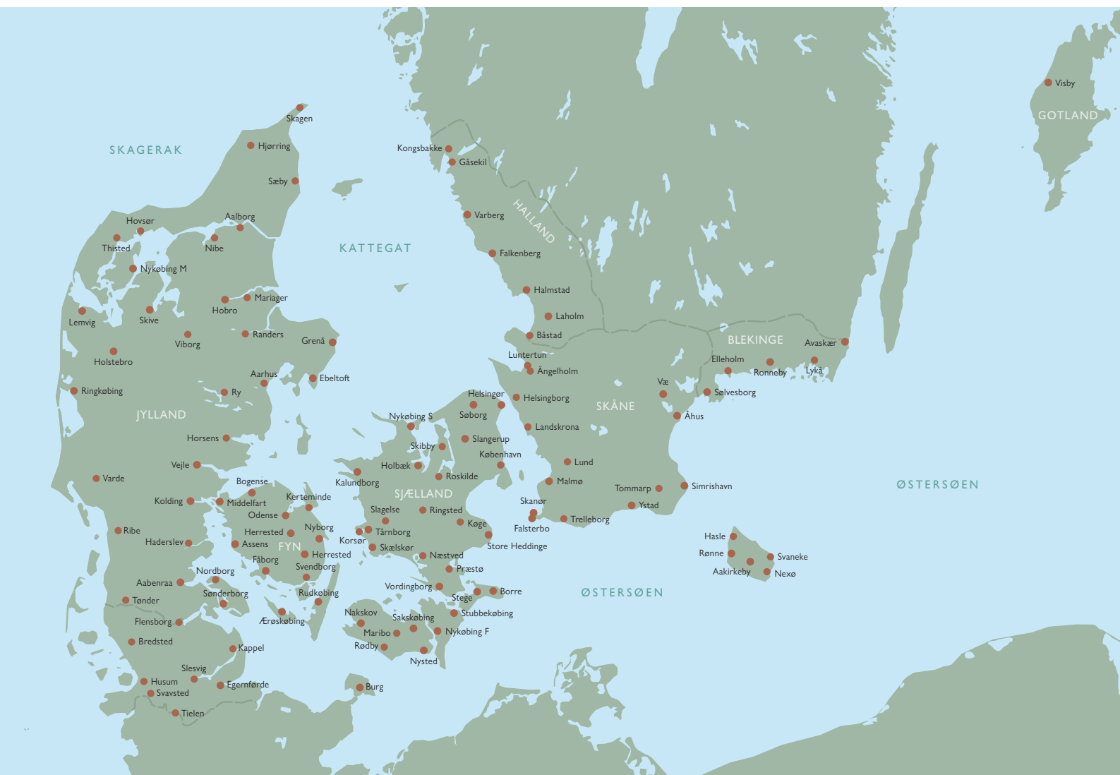
Fig. 1.2.1. Danmarks middelalderbyer inden for denne bogs periode, 700-1536. Visby på Gotland kan efter 1361 regnes som dansk.

i årene ca. 973-85. 25 Der synes at være realiteter bag den store Jellingestens hædrende omtale af ”den Harald, som vandt sig hele Danmark og Norge og gjorde danerne kristne.”